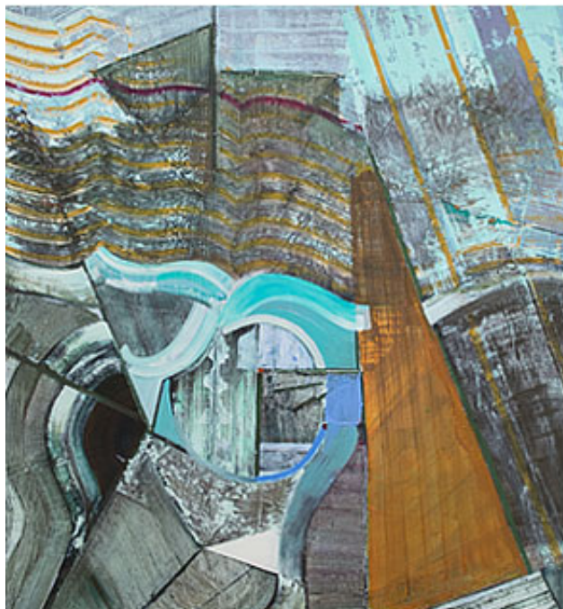
"Home maid skin" 140x130 cm, opd © Simon Gorm Andersen