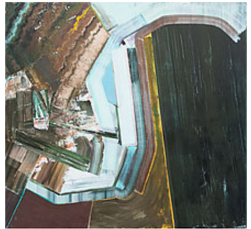
"Year of the garden month of the milk" 140x130 cm, opd © Simon Gorm Andersen

APA Gallery, Stockholm | Omkonsts startsida